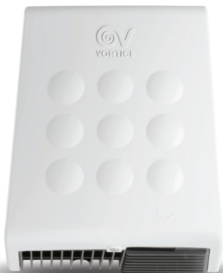
OPTIMAL DRY A код 19229