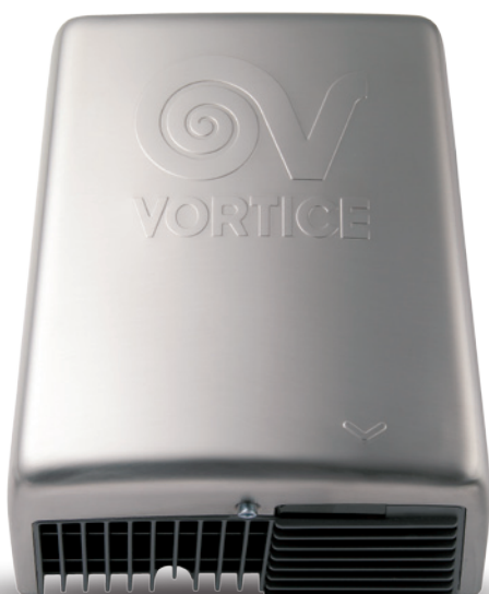
OPTIMAL DRY METAL код 19235