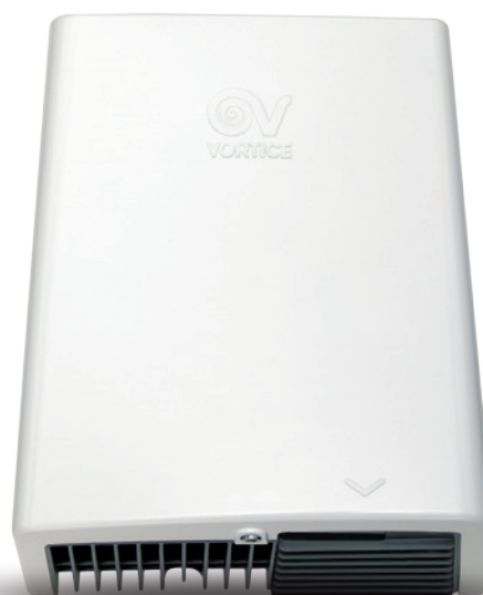
OPTIMAL DRY R A код 19227