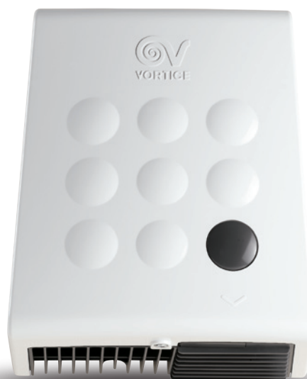
OPTIMAL DRY код 19226