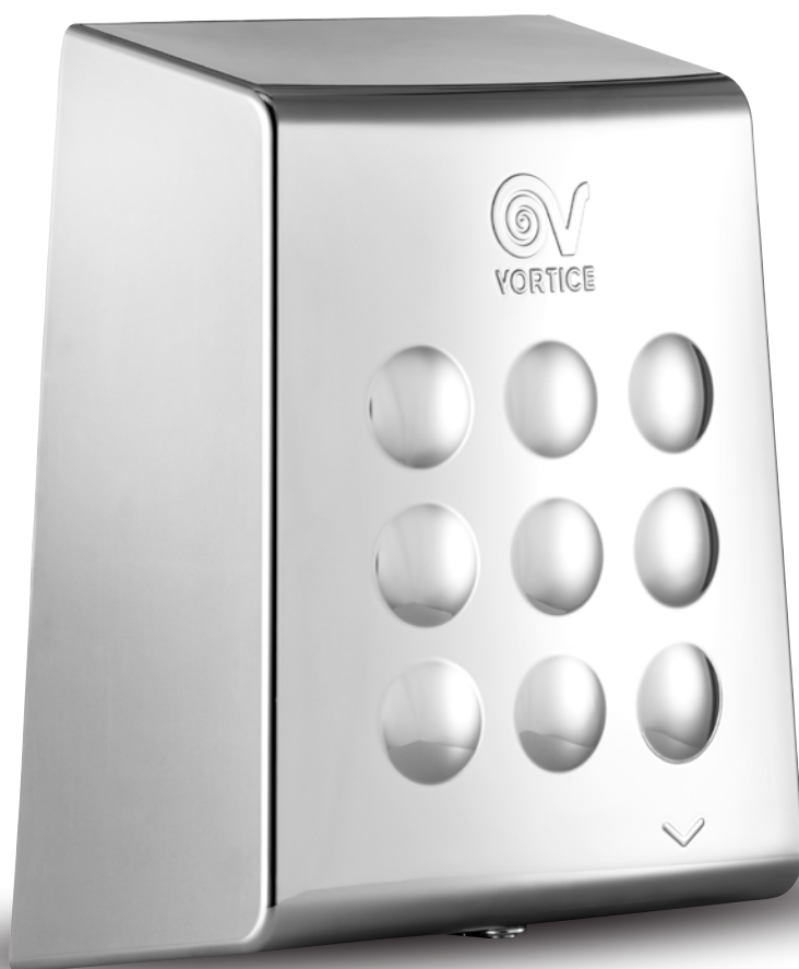
OPTIMAL DRY AUTOMATIC WHITE GOLD